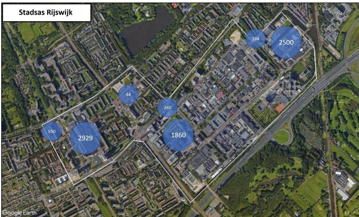
Figuur 2.1 | Stadsas Rijswijk en te realiseren aantal woningen

De gemeente Rijswijk bevindt zich midden in een fase van forse stedelijke vernieuwing en groei. Binnen het bereik van station Rijswijk, in de Stadsas (figuur 2.1), worden de komende jaren circa 9.000 nieuwe woningen gerealiseerd met ruimte voor kennisintensieve bedrijven, onderwijs en innovatie in een prettige leefomgeving. Daarmee ontwikkelt Rijswijk zich tot een goed verbonden stad met een aantrekkelijk woon- en vestigingsklimaat.